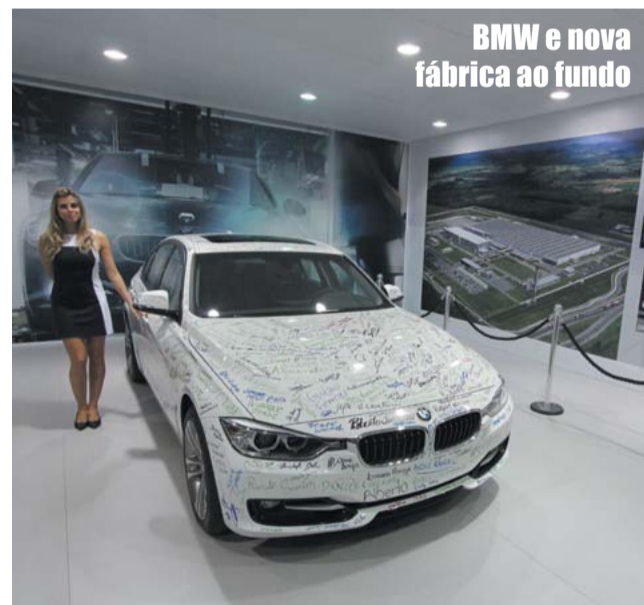
BMW e nova fábrica ao fundo