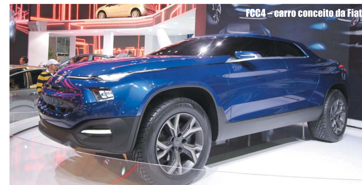
FCC4 – carro conceito da Fiat